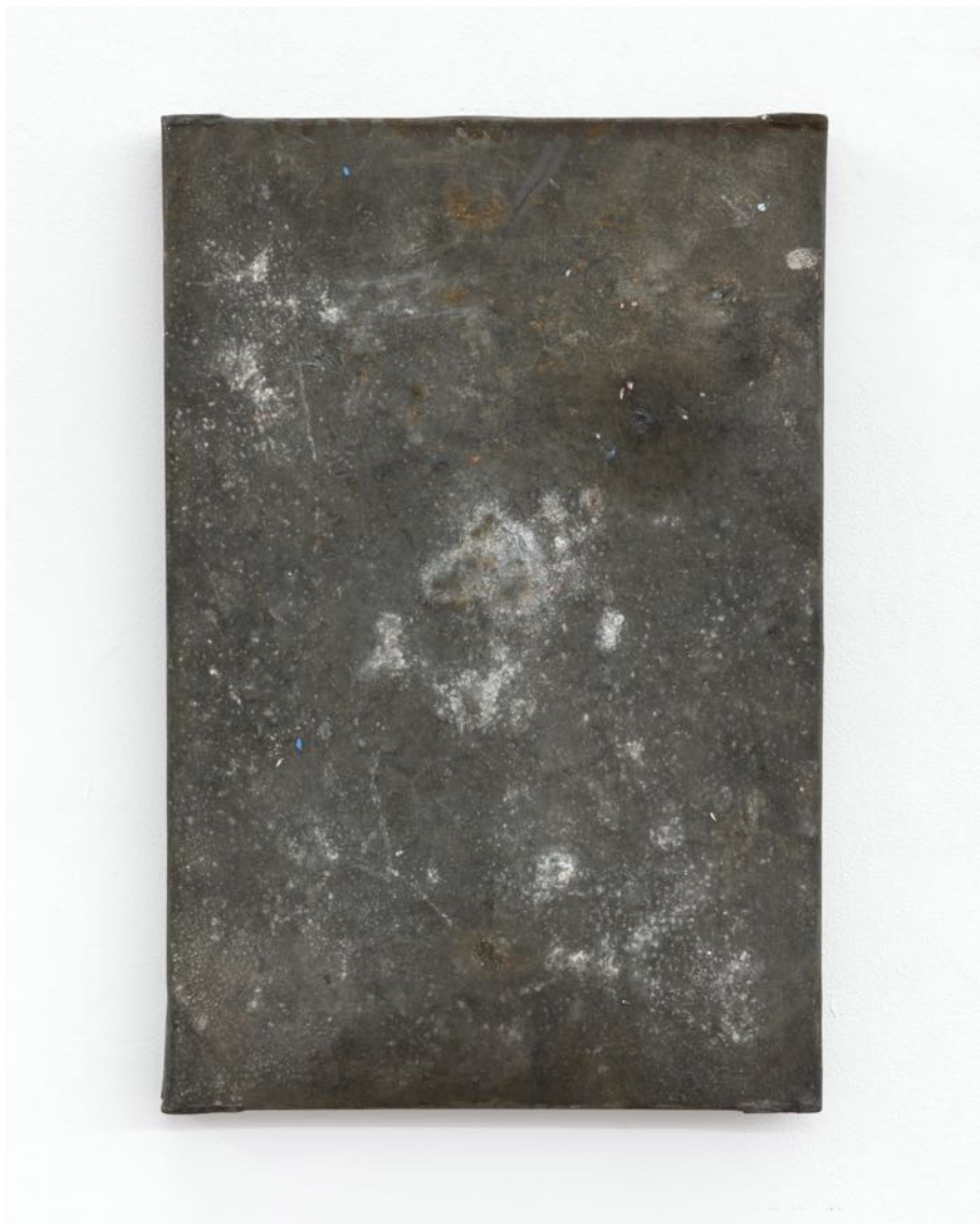
Charlotte Vandenbroucke "Formalities" , 2023 Metal object trouvé + oil 30 x 46 cm