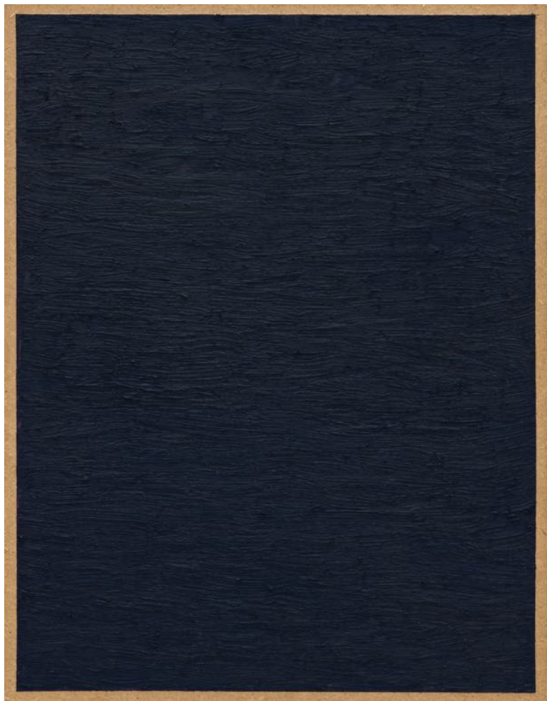
Charlotte Vandenbroucke "Nachtraam" (vue sur la nuit), 2023 oil and pigments on masonite 43 x 55 cm