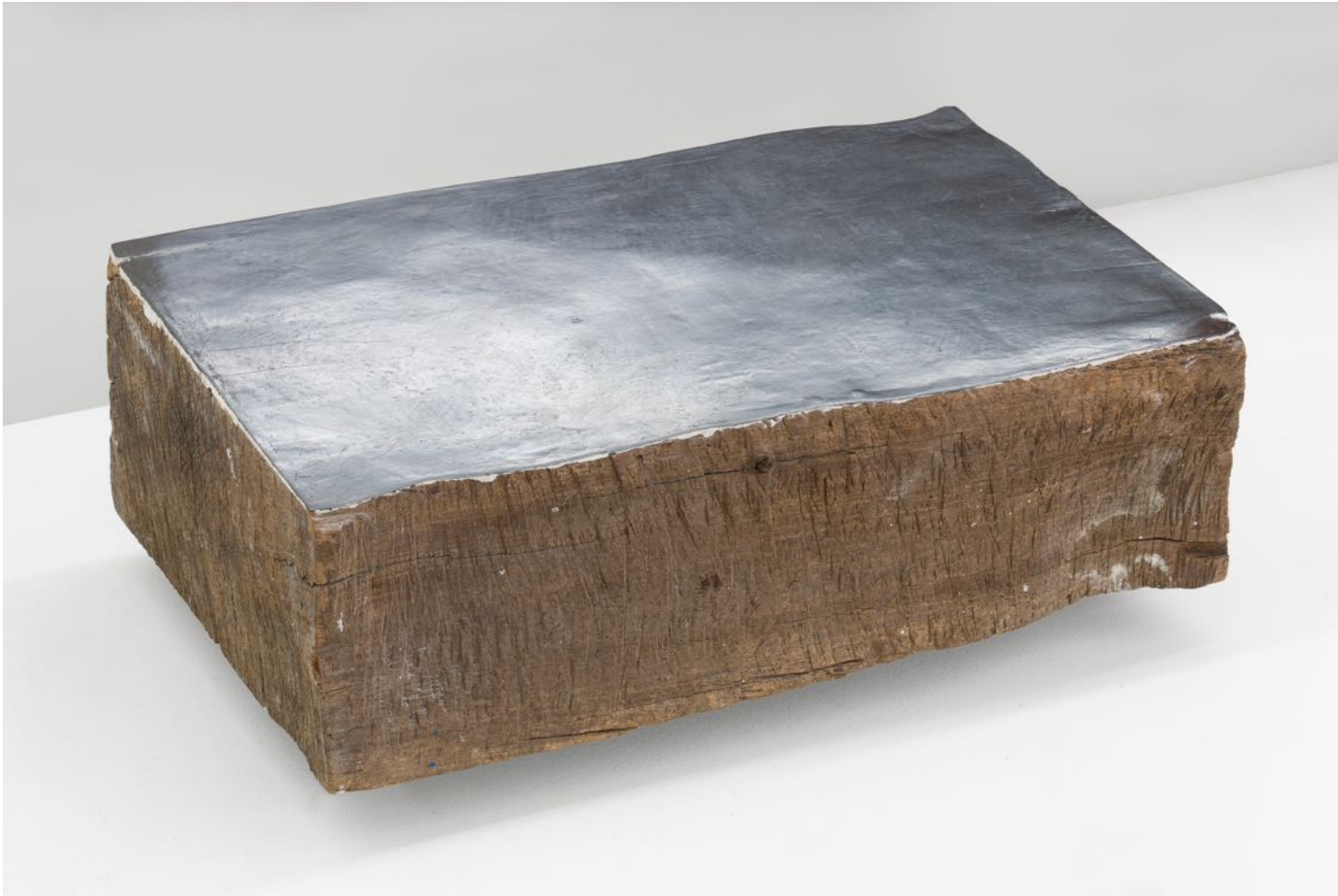
Charlotte Vandenbroucke "Untitled" , 2023 wood, graphite and acryl 28 x 46 x 14 cm