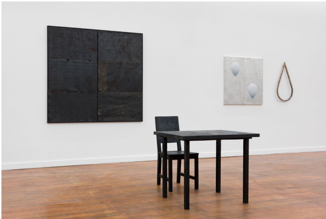
Ensemble (roofing + table + chair)