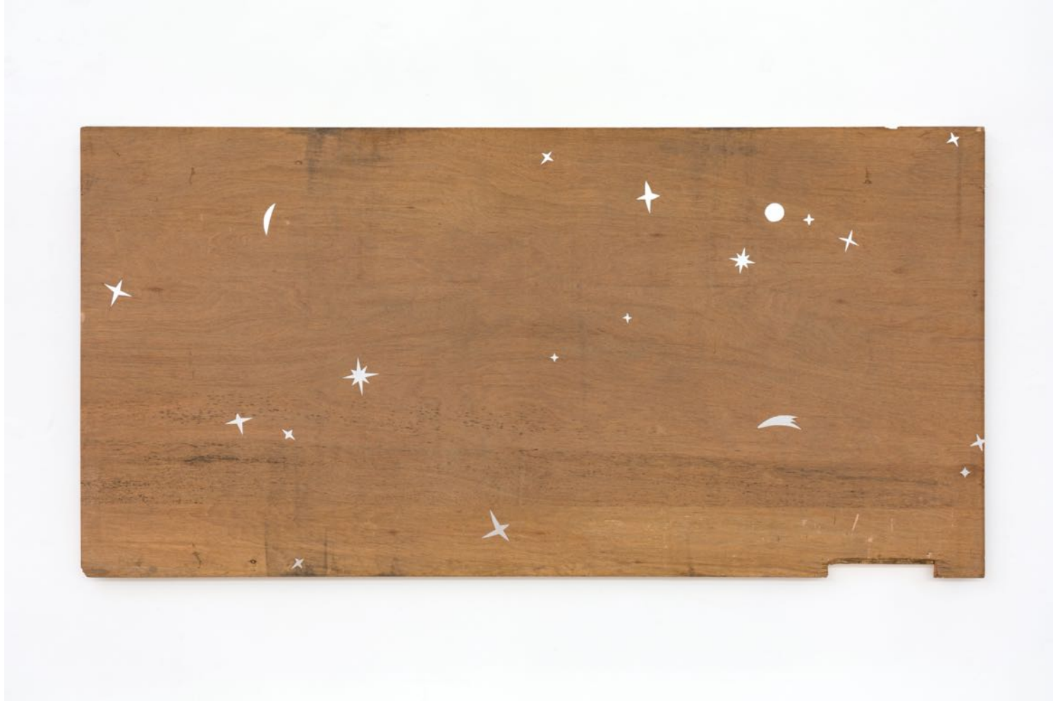
Charlotte Vandenbroucke "The Universal Map of Memories" , 2023 aluminium on panel 122 x 144 cm