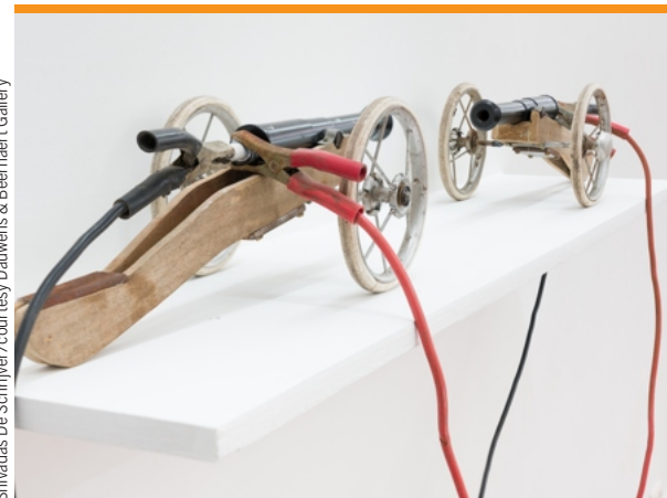
Shivadas De Schrijver/courtesy Dauwens & Beernaert Gallery

De expert dient de scepticus van antwoord