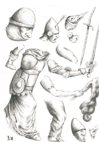
Antoine Roegiers, 'Gula', 2011. Sepia inkt op papier, 29,7 x 40,5 cm. Te zien bij Keteleers Gallery. © De kunstenaar.