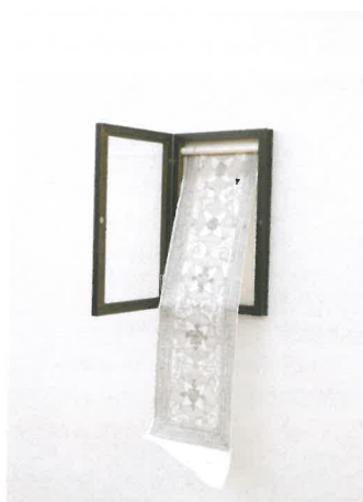
Marco De Sanctis, 'Tapisserie II', 2012. Te zien bij Dauwens and Beernaert. © De kunstenaar.